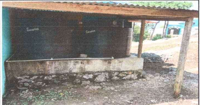
Foto 4: Impermeabilización de paredes de aula uno, y levantamiento de muro para la inclinación 45 grados para la distribución de agua.