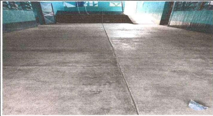
Foto1: Sustitución de piso concreto por piso ceramico para salón.