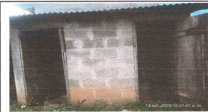
Foto 5 Reparación de letrina o baño por Fósfa septica.