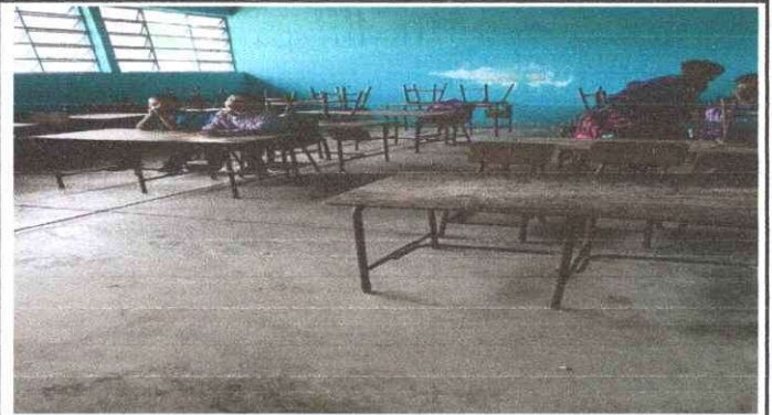
Foto2: Sustitución de piso concreto por piso ceramico para tres aulas, 1 dirección y 1 bodega.